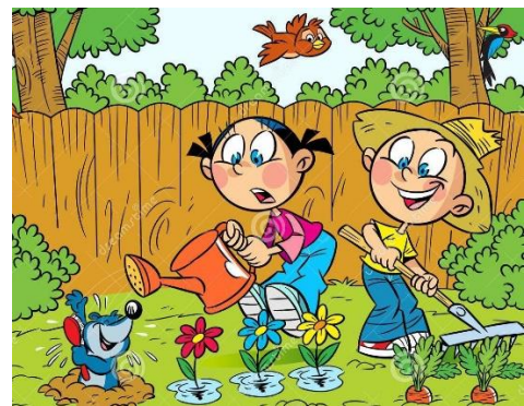
In de tuin werken