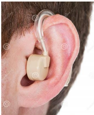
Een gehoorapparaat dragen

Kijk eens naar onderstaande situaties. Horen deze bij een oud of een jong iemand of kan het bij allebei passen? Kun je vertellen waarom?