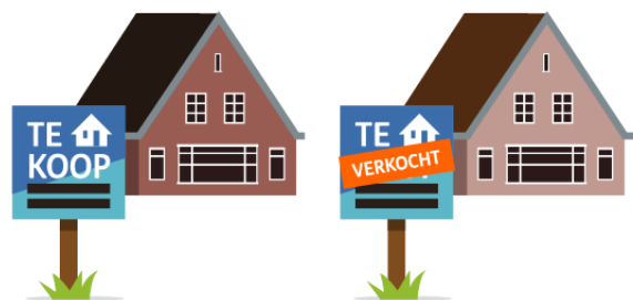
Een huis kopen

Hoe oud ben jij? Weet jij al wat je later worden wilt?