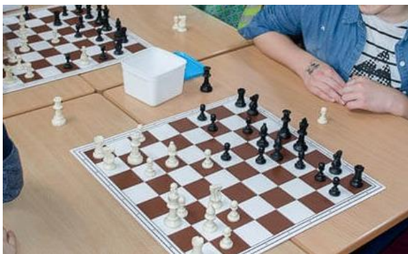
Op schaakles zitten