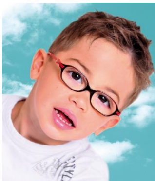
Een bril dragen